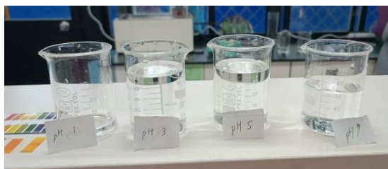
圖一:不同 pH 值的檸檬酸水溶液