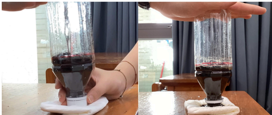
步驟三：倒入水（比土高）