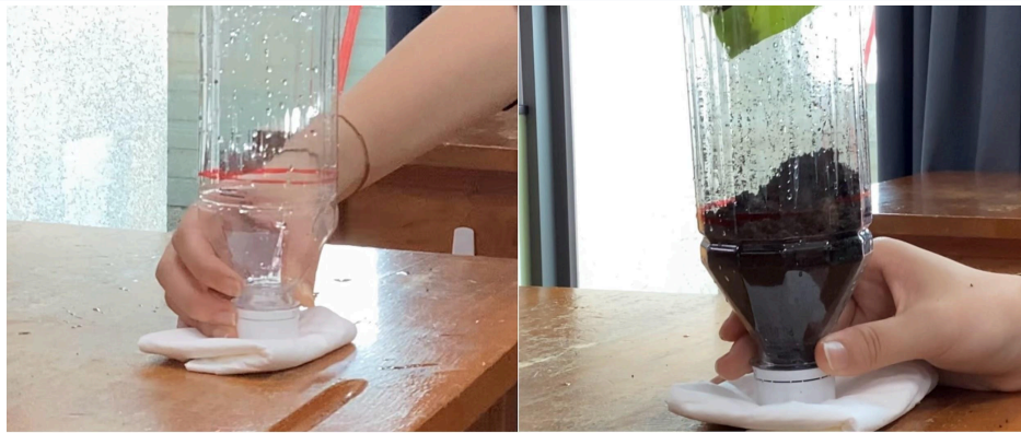
步驟一：畫上紅色標記