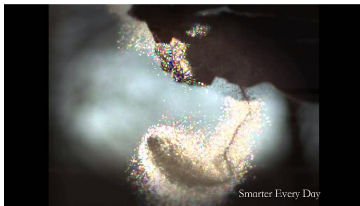
在高速攝影下魯伯特之淚破碎的瞬間

魯伯特之淚能夠擁有強大的硬度，卻也能被一碰就碎，為什麼？剛才提到因為「熱脹冷縮」使得外層不斷向內層擠壓形成了「壓應力」，被擠壓的內層卻也因此形成了另一股力量，稱為「拉應力」，當魯伯特之淚完全凝固時，壓應力與拉應力之間也達到了完美的平衡，而魯伯特之淚的尾巴與面積大的圓形頭部不同，非常細小，容易破裂。因此當魯伯特之淚的尾巴被施加壓力時，將會使整個淚滴爆裂，化為粉末四散各處。