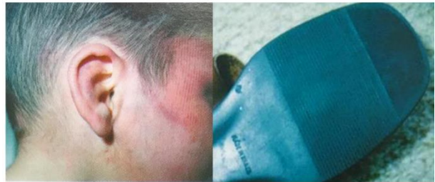
圖三、拖鞋的典型傷痕