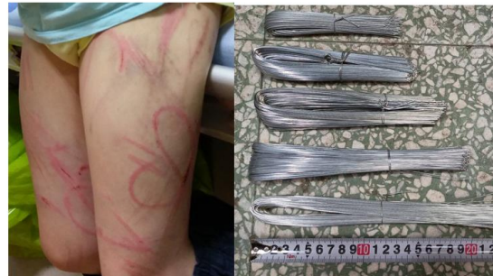
圖五、鐵絲的典型傷痕