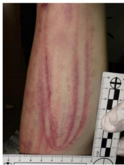
圖二、塑膠水管的典型傷痕