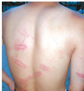
圖四、皮帶抽打的典型傷痕