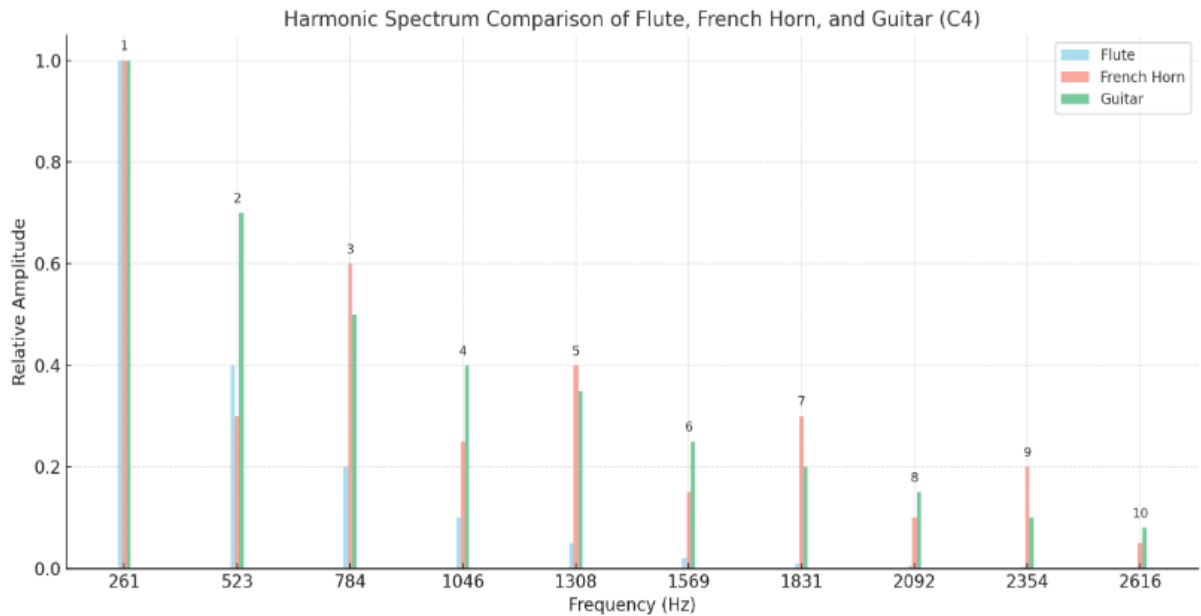
三種樂器的頻譜比較圖(藉由 ChatGPT 輔助繪畫)