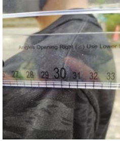
(圖 14) 30cm