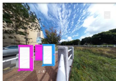
(圖 1) 用 PowerPoint 製成封面 (圖 2)載入前