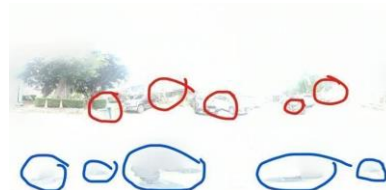
(圖 20) 90 度 30cm 全景照片