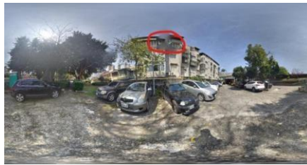
(圖 21)100°，40cm 的全景照片，紅色圈起處為銜接不良

我們接著使用了上一組 90°，40cm 的照片來比較，固定了 40cm，角度為 90°、100°來比較，我們發現角度越大，拍攝的照片越佳。