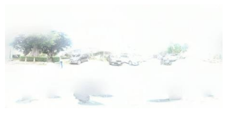
(圖 16) 全景照片