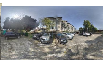
(圖 5)從手機開始量 (圖 6)到肩膀 40cm (圖 7)角度 100° (圖 8)全景照片