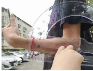
(圖 15) 90°