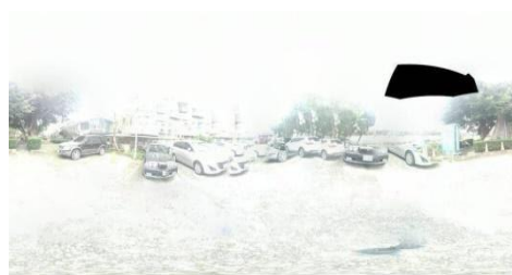
(圖 9)起點 (圖 10) 40cm (圖 11) 90° (圖 12) 全景照片