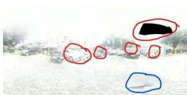
(圖 19) 90 度 40cm 全景照片

原本認為半徑越小誤差值越小，但因為拍照者是人，當半徑越小時，拍照時手會顫抖，使影像模糊，且可能會造成自己的身體入鏡，我們固定角度為 90°，距離使用 40cm 和 30cm 來比較，我們發現半徑越小時，反而會造成照片的成像會越不佳，半徑越大時，照片成像會更好。((圖 26)、(圖 27)紅色圈起處為銜接不良、藍色圈起處為身體入鏡)